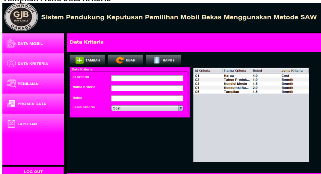
Gambar 4. Tampilan Menu Data Kriteria

Pada layar menu kriteria dan bobot akan menampilkan inputan dari data kriteria yang terdiri dari Id Kriteria, Nama Kriteria, Bobot, Jenis Kriteria.