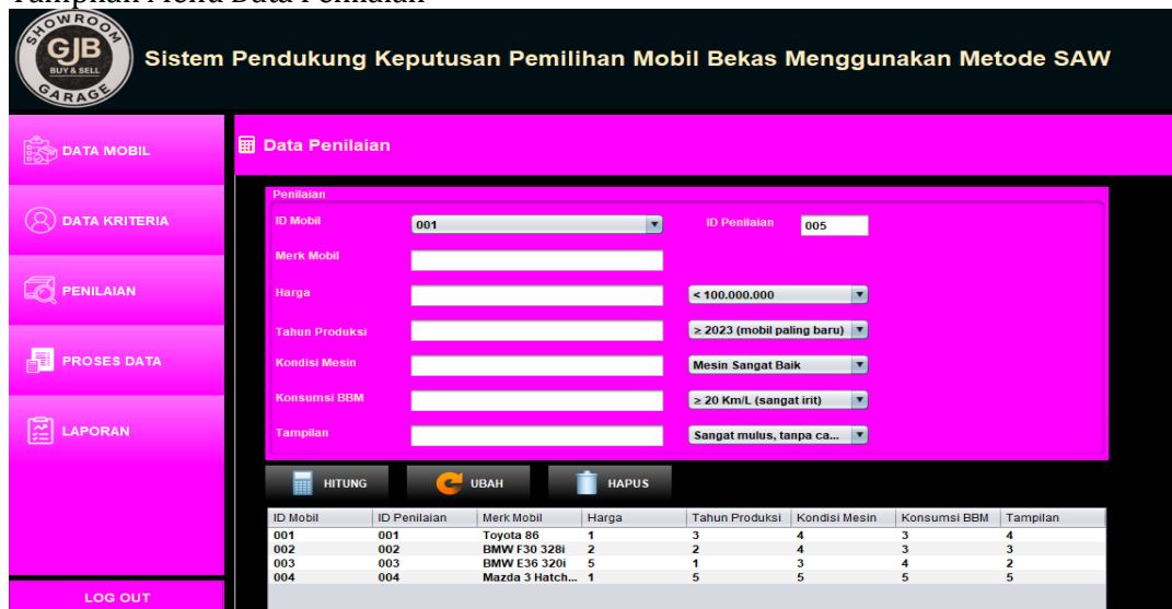
Gambar 5. Tampilan Menu Data Penilaian

Pada layar menu penilaian yang terdiri dari ID Mobil, Id Penilaian, Merk Mobil, Harga, Tahun Produksi, Kondisi Mesin, Konsumsi, Tampilan/Kondisi Fisik.