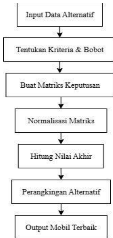
Gambar 1. Diagram Alir Simple Additive Weighting

Metode Simple Additive Weighting mengenal adanya 2 (dua) atribut yaitu kriteria keuntungan alternatif dan kriteria biaya. Perbedaan mendasar dari kedua kriteria ini adalah dalam pemilihan kriteria. Ketika mengambil keputusan, metode ini membutuhkan proses normalisasi matriks keputusan ( X ) ke suatu skala yang dapat di perbandingkan dengan semua rating alternatif yang ada.