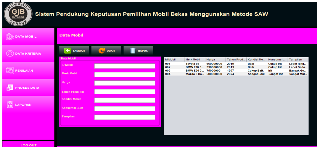
Gambar 3. Tampilan Menu Data Mobil

Pada layar menu data mobil akan menampilkan inputan dari data sepeda mobil yang terdiri dari ID Mobil, Merk Mobil, Harga, Tahun Produksi, Kondisi Mesin, Konsumsi, Tampilan Fisik.