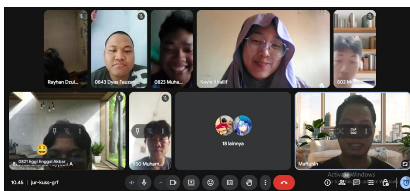
Gambar 2. Pelaksanaan Pengabdian Kepada Masyarakat

Meskipun partisipasi dalam pelatihan cukup tinggi, tantangan yang dihadapi adalah konsistensi dalam pengelolaan formulir elektronik. Beberapa peserta merasa kesulitan untuk terus membuat konten secara rutin setelah pelatihan berakhir. Diperlukan danyafollow-upatausesi pelatihan lanjutan untuk memastikan warga tetap termotivasi dan terampil dalam menggunakan formulir elektronik sebagai media sosialisasi.